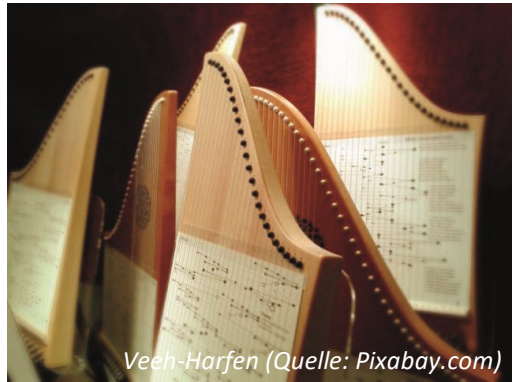
Veeh-Harfen