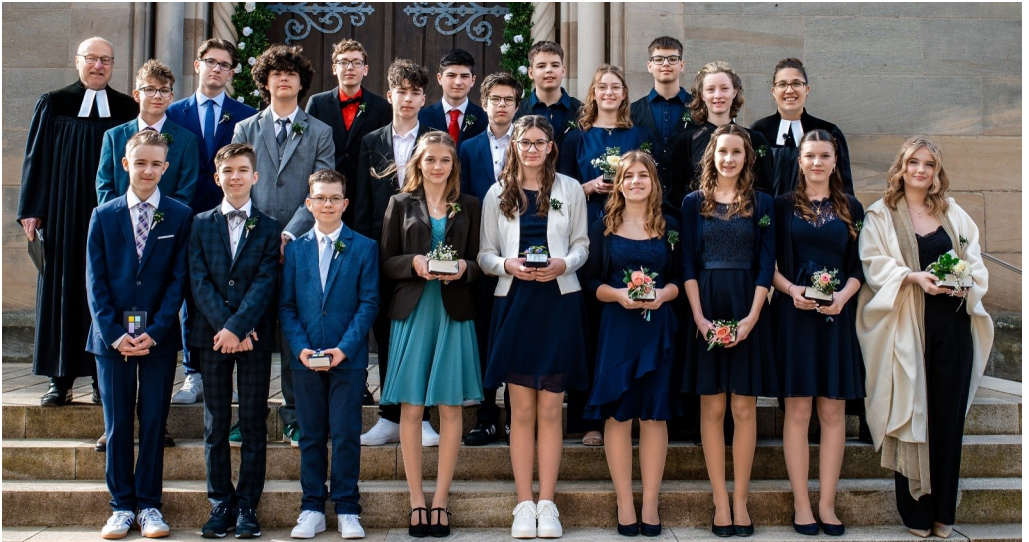
Unser diesjähriger Konfirmationsjahrgang

Festlich gekleidet mit tollen Frisuren, unserem Konfischmuck und unseren neuen Gesangbüchern haben wir uns bei super Wetter um 09.30 Uhr zum Gruppenfoto vor dem Münster getroffen. Zum Gottes-