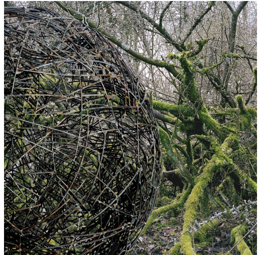
Die Form zweiter Ordnung - Fotomontage von Wolf-Dietrich Weissbach

Wir laden herzlich ein zu den folgenden Veranstaltungen im Rahmen der Jahresausstellung: