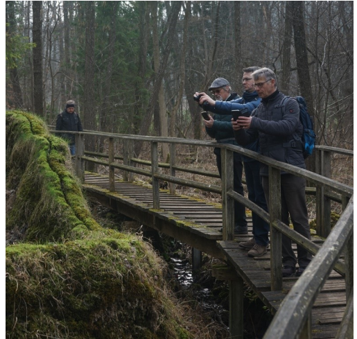
Fotoshooting an der Steinernen Rinne

Von hier ging es entlang der Teufelsmauer des Limes teils weglos nach Höttingen und danach noch zum rekonstruierten Römerkastell Ellingen. Jetzt war es nicht mehr weit zum Ziel der Wanderung in Ellingen. Im Fürst Carl Bräustüberl gegenüber des Deutschherrenschlosses kamen