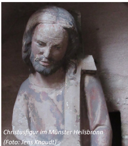
Christusfigur im Münster Heilsbronn

Verteilung: Mittwoch 29.09.2021 um 14:00 Uhr im EGZ