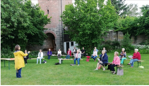
Im Freien und auf Abstand, aber endlich wieder miteinander singen können ...

Entbehrungsreich war die Chorarbeit in den zurückliegenden Monaten. Wie in so vielen Bereichen ging auch in der Kirchenchorarbeit nicht viel. Damit fiel nicht nur ein wesentlicher Teil der musikalischen Arbeit weg, sondern auch die Möglichkeit zu sozialen Kontakten. Chorarbeit ist Seelenarbeit. Aber wir haben eine tolle Chorleiterin, die viele Möglichkeiten fand, das Singen in kleinen Gruppen in Gottesdiensten doch möglich zu machen, so lange die Gemeinde nicht singen durfte.