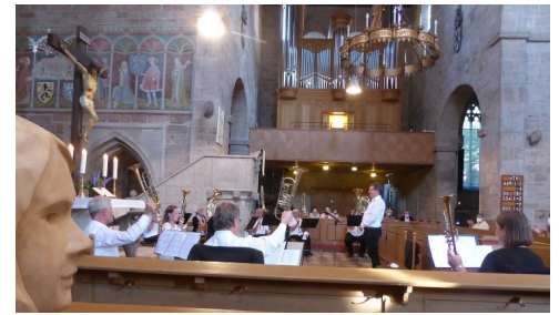
Posaunenchorgruß nach der Geistlichen Musik am 24.06.21

Und dann im Sommer konnten wir als kompletter Chor Gottesdienste spielen und Volkslieder blasen. Im Herbst war es dann sehr schnell klar, dass es wieder eine Pause geben wird und dass diese länger sein wird als die vorherige. Wir durften als Quartette auftreten, dies wurde vor allem an Weihnachten wichtig, um die Gottesdienste auf dem Marktplatz zu gestalten.