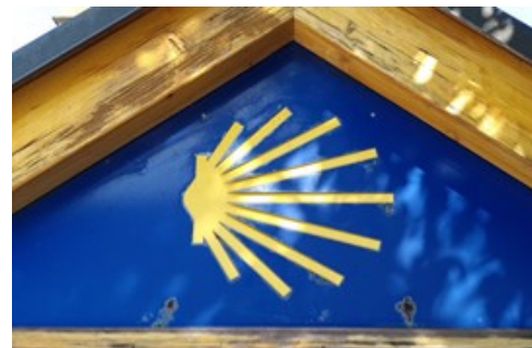
Auf dem Jakobsweg

Für den kommenden Mai 2022 laden wir schon jetzt herzlich zu zwei Touren auf dem Fränkischen Jakobsweg ein: