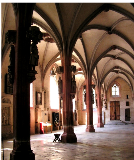
Blick ins Mortuarium des Münsters

Bitte melden Sie sich doch bei Pfarrerin Ulrike Fischer.