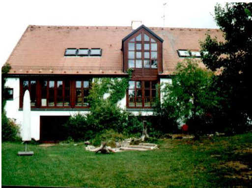
KiTa „Unterm Regenbogen“