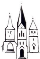
Evang.-luth. Kirchengemeinde St. Nikolai Neuendettelsau